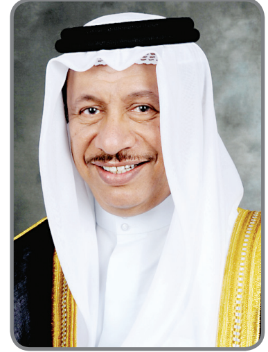
سمو رئيس مجلس الوزراء الشيخ جابر المبارك الحمد الصباح