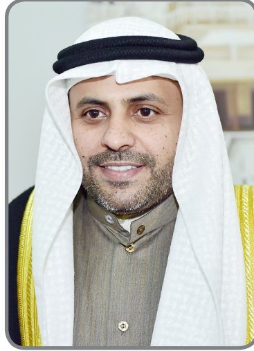
وزير الإعلام وزير الدولة لشؤون الشباب ورئيس المجلس الوطني للثقافة والفنون والآداب محمد ناصر الجبري

الأمين العام للمجلس الوطني للثقافة والفنون والآداب